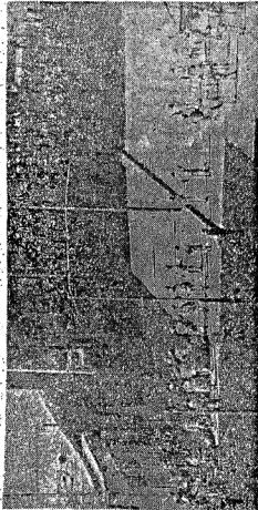
أحداث ١٨ - ١٩ يناير

يوم ١٨ يناير ١٩٧٧ حيث الجماهير من الاستكبرية حتى أسوار قصر عن عقبها القرد الجوية الاقتصادية سالم برع الأسار . . . وتواصلت الأتامة التسمية يوم ١٩ يناير . . . وعنت الجماهير فد سياسات النظام الإفتاحي الذي كان أثاره قد ظهرت وبلا وقرا وجوما للثانية الساحة . . .